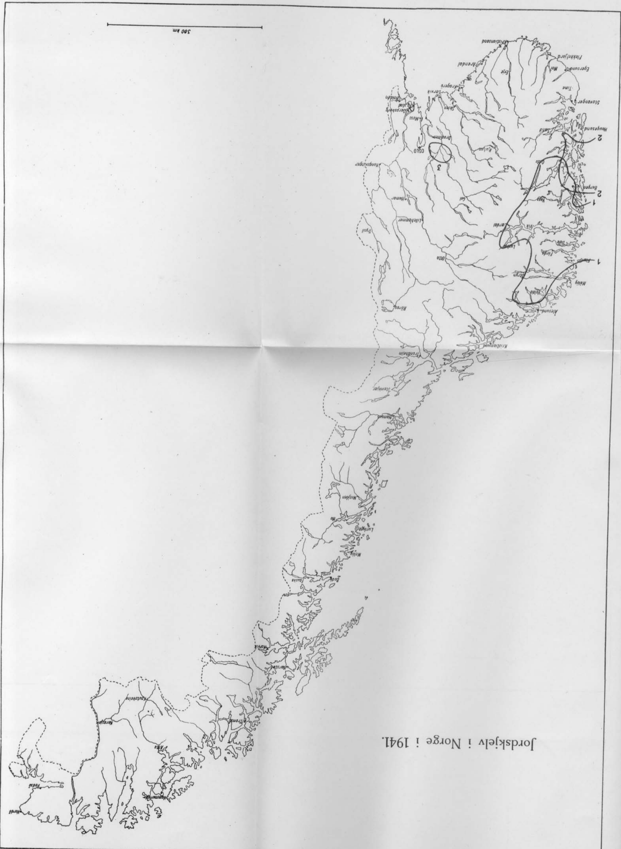
Jordskjelv i Norge i 1941.